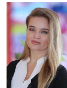
Мисс Яна Ассистент преподавателя Nursery