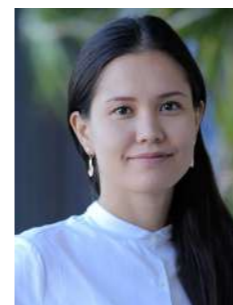
Мисс Айдана Ассистент преподавателя Nursery