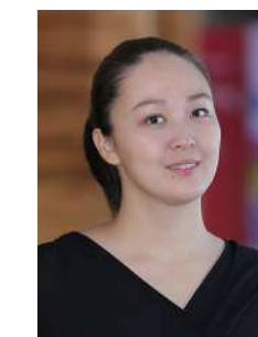
Мисс Ассем Ассистент преподавателя Nursery